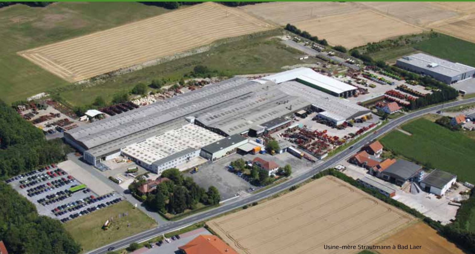
Usine-mère Strautmann à Bad Laer

La société B. Strautmann & Söhne GmbH u. Co. KG est une entreprise familiale de taille moyenne de la région d'Osnabrück qui, après plus de 80 ans d'existence, est aujourd'hui dirigée par la troisième génération. Sur son deuxième site de production, une usine moderne à Lwówek (Pologne), Strautmann produit également, en dehors de différents composants de machines, une partie de la gamme d'engins tels que bennes bascu-