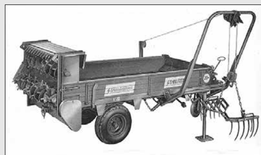
Le «Streublitz» avec chargeur latéral en 1957

Les épandeurs Strautmann se distinguent par leur robustesse, leur longévité et leur flexibilité. Leur capacité de charge élevée et leur durée de vie importante sont leurs principaux points forts.