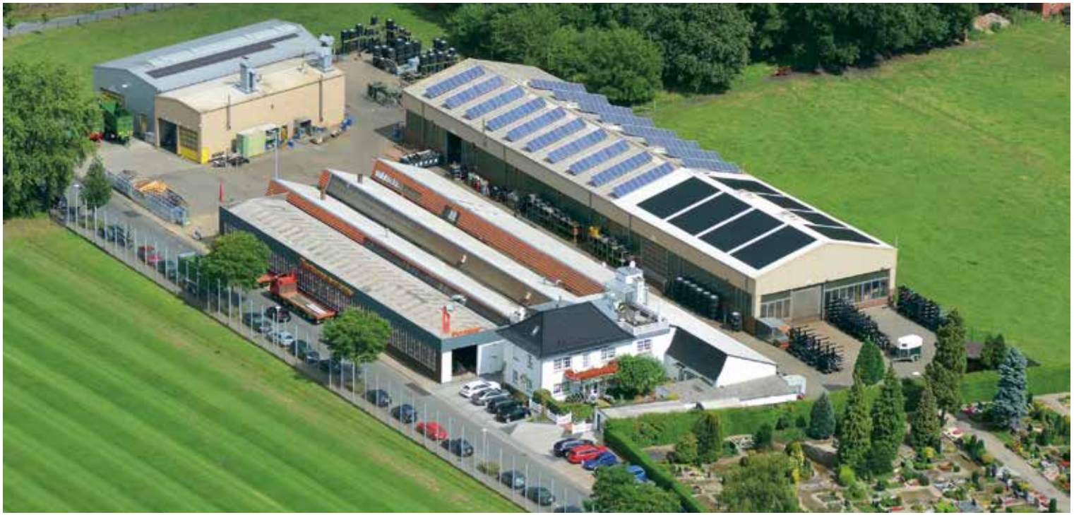
Produktionsstandort I 'Alte Maate' – 48607 Ochtrup (Deutschland)