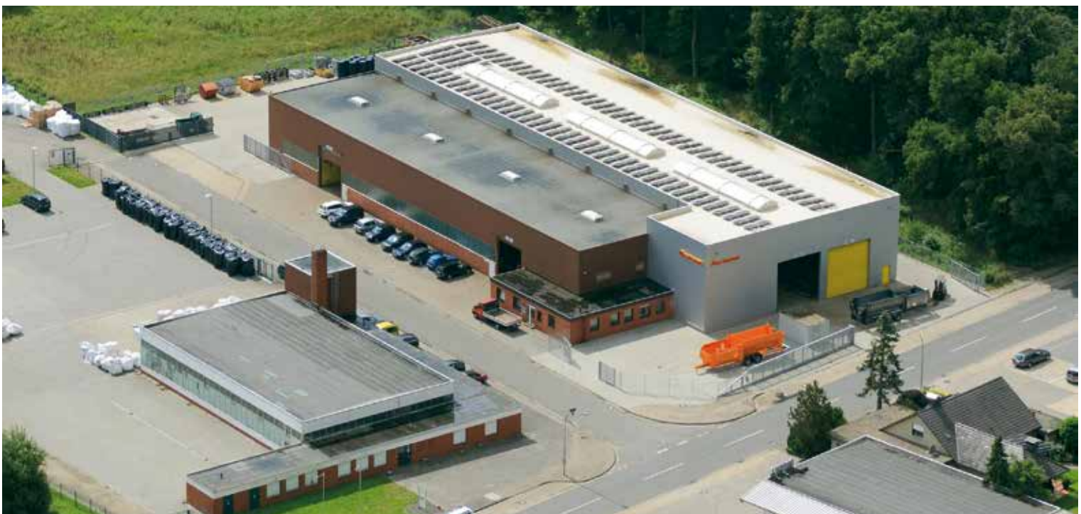
Produktionsstandort II 'Schützenstraße' – 48607 Ochtrup (Deutschland)