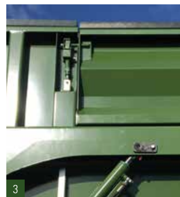
3. mechanische Verriegelung (hinten)