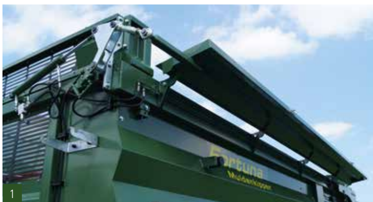
1. hydraulisch abklappbare Seitenwand