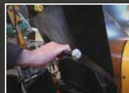
Hebel für leichte Materialien Steuerung