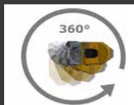
Rayon de braquage 1m35